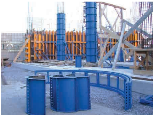
Circular Column Formwork with wheeled carrier where crane access is not possible.